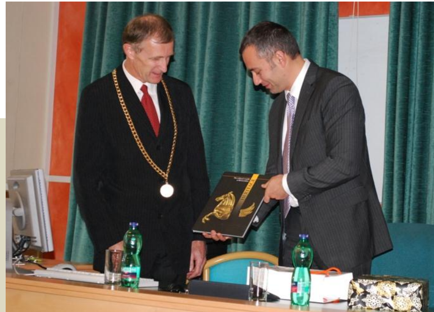
Bulharský ministr zahraničí Nikolaj Mladenov (2010)

Více informací na http://tarantula.ruk.cuni.cz/FSVINT-1160.html